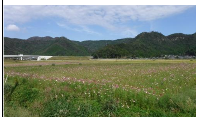
ヒメイワダレソウの植栽